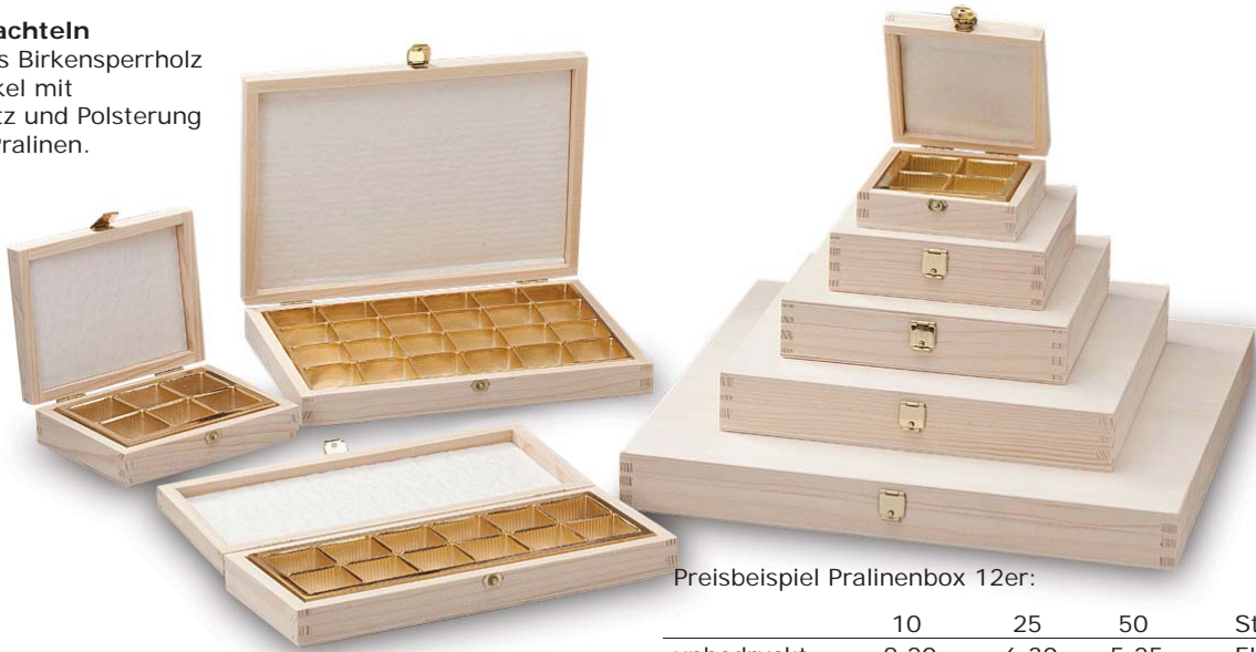
Preisbeispiel Pralinenbox 12er:

Holzboxen aus Birkensperrholz mit Klappdeckel mit Pralineneinsatz und Polsterung Für 4 bis 64 Pralinen.