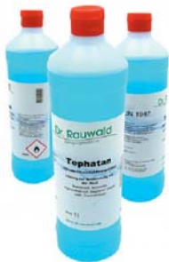
Händedesinfektionsmittel Art-Nr. DES20-0100

Preise pro Stück, ab Werk, exkl. 20% Mehrwertsteuer.