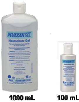
Hautschutz-Gel Art-Nr. DES10-xxxx