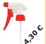
Sprühaufsatzl Art-Nr. DES50-ZU01