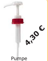
Pumpe Art-Nr. DES10-ZU01