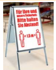
Plakate und Zubehör