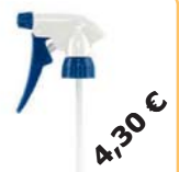
Sprühaufsatzl Art-Nr. DES20-ZU01