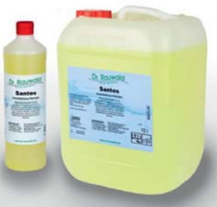
Flächendesinfektionsmittel Art-Nr. DES50-xxxx

Preise pro Stück, ab Werk, exkl. 20% Mehrwertsteuer.