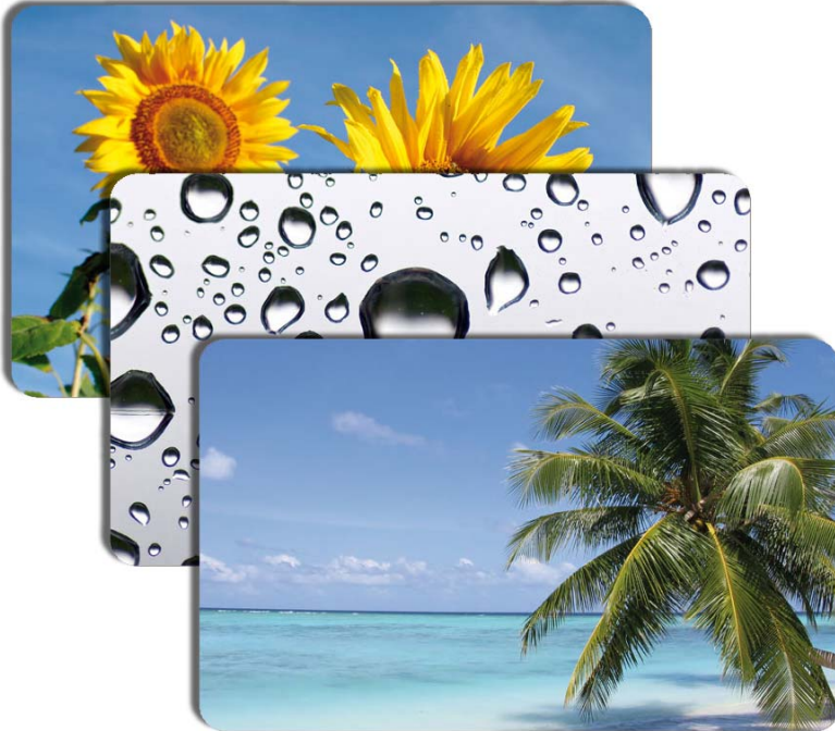
Frühstücksbrettchen Art-Nr. WX200