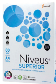
Niveus Superior Art-Nr. KP018-40800