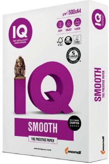
IQ Selection Smooth Art-Nr. KP009-40800