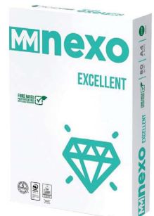
NEXO Excellent Art-Nr. KP010-40800